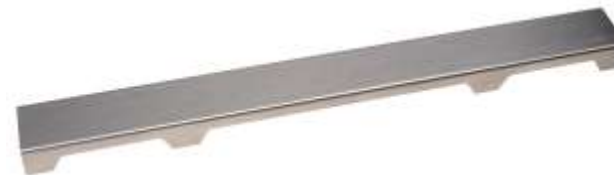
Рис. 2. Решетка HL0531Prblue-S.

Данная решетка подходит для напольной плитки толщиной до 13 мм (включая плиточный клей)