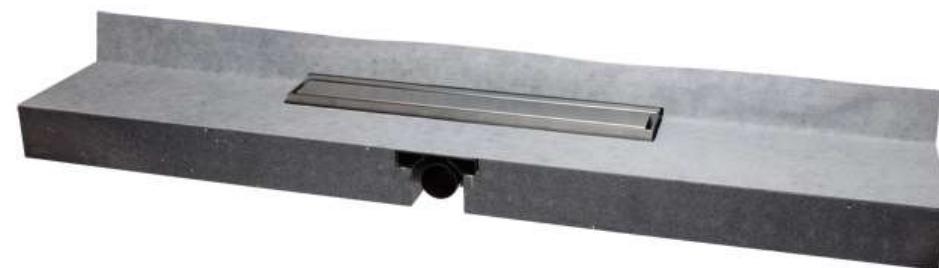
Душевой лоток серии HL531Prblue