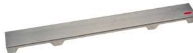
Рис. 3. Решетка HL0531Prblue-D.