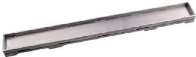
Рис. 4. Решетка HL0531Prblue-I.

6.3. HL0531Prblue-I – серия «Индивидуальная», решетка из нержавеющей стали с матовой поверхностью. Данная решетка предназначена для вклеивания в неё мозаики или облицовочной напольной плитки толщиной до 12 мм (включая плиточный клей)